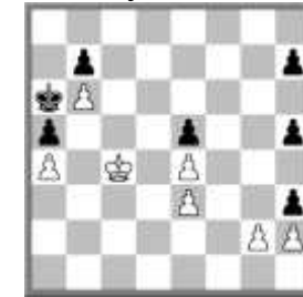
Uduş (+) b) pg2 → g4

Xüsusi tərifnamə/ Special Com Azerbaijan CCC-35 JT